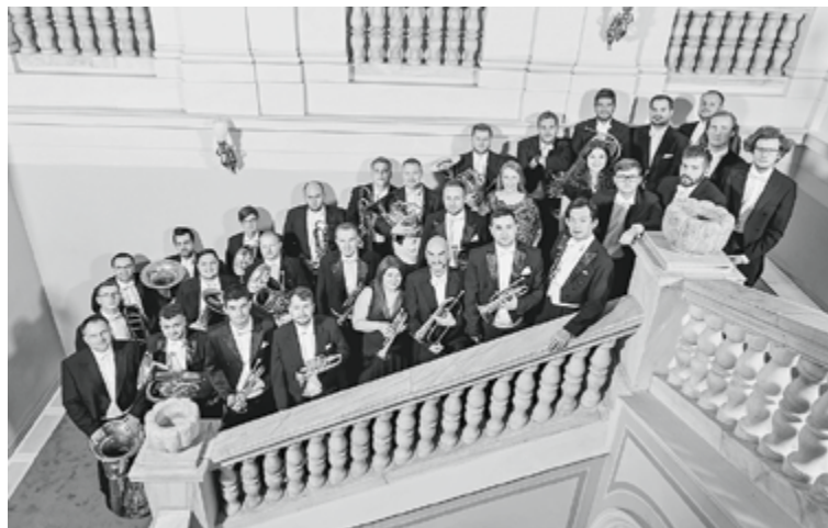
Moravia Brass Band